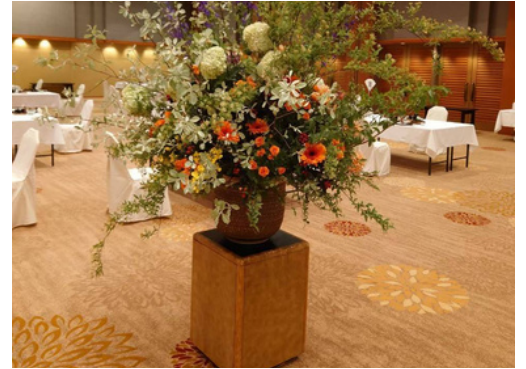
評価の高い当社のアレンジ

販売スタッフの体感になるが、新規来場者も多く、年齢層も下がった印象とのことであった。今後もFacebook広告を活用しアンケート等で来店理由調査を行い、広告効果を見える化したい。