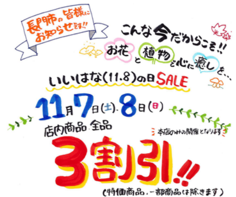
反応がよかった手書きのSNS広告画像