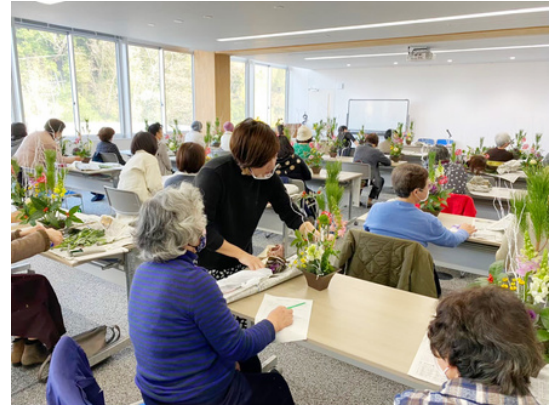
フラワーアレンジメント教室の様子

相談者が最初に来訪した際には、フラワーデザイナーとしてのイメージが強く、どのように事業を続けていけばよいか悩んでいる様子であった。そのため、相談者のこれまでの経歴や事業への思いを、傾聴の姿勢でじっくり聞くことに徹した。すると、スタッフを含めお花の知識が深く親しみやすい人柄であることが判明。スタッフを含めチームでキャラクター作りに取り組むことでブランディングに向けて積極的な行動を促せたと思う。