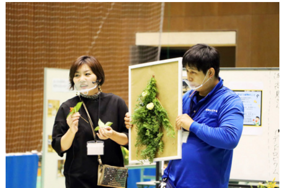
「花と遊ぼう!学ぼう!2020」イベントの様子

平成20年12月フラワーアレンジメント教室を開業。学校の体験教室やPTA活動、花博をはじめ山口県産花に関するイベントを主催。個人として全国フラワーアレンジメントコンテストにて受賞多数。令和2年『お花のお届け便 ハチ』をブランド化し、山口県産のお花や花材を取り扱うネットショップを立ち上げる。たくさんの人がお花に触れ合うきっかけづくりになれるよう活動中。