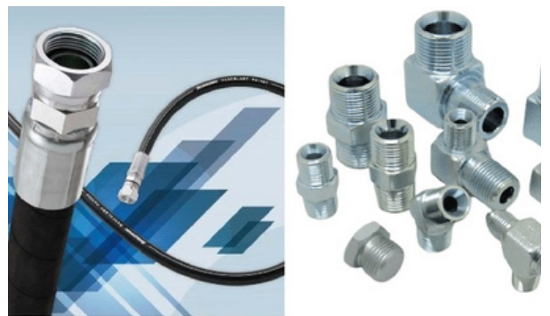
取扱商品（ホース、継手）

平成2年創業。油圧機器及び油圧部品の設計・製作・販売を手掛ける。新システムの開発から、油圧配管部品の販売まで、ワンストップで対応。継手・プラグ、油圧ホースなどの、専門性が高い部品を幅広く扱えるのも強み。コロナ禍において販路拡大を目指し、令和2年2月に「フジテクノWEBカタログ」を開設。アクセスが好調のため、令和3年にオンラインショップ「ツギタロウ.com」をオープンし、B to B商材のネット販売に力を入れている。