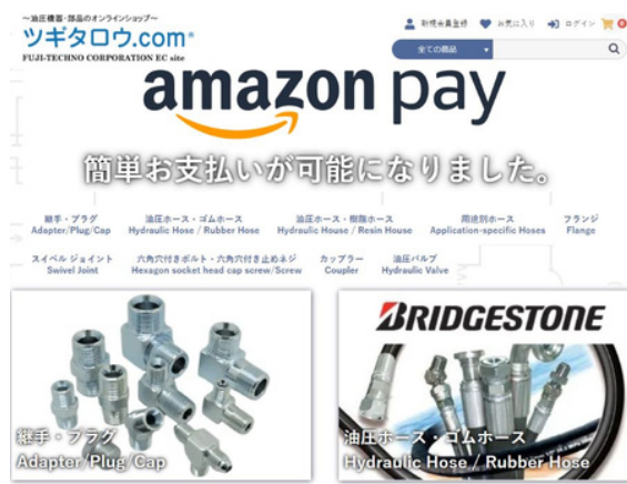
ツギタロウ.comトップ

また、既存顧客とオンラインショップの顧客とでは、商圏もニーズも異なる可能性があることを意識して、アクセス解析データを元にオンラインの顧客像を把握し、それに合わせた施策を提案しました。