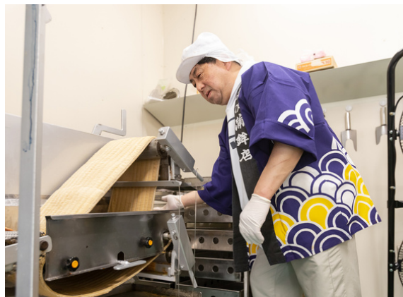
「魚の練り物」はエソ100%

初回の相談では、魚介類の加工品のパッケージへの固定観念があり、相談者はよく見るデザインや商品名にすることが当たり前と思っていたので、ブランディングの必要性を理解してもらえるように心がけた。商品の独自性を活かしながら、ターゲットに向けたブランディングにより、新しい矢次ブランドができることで、今後の販売活動や商品開発への意欲に繋がった。また、全てオンライン相談であったため対面以上に情報収集とコミュニケーションに配慮した。