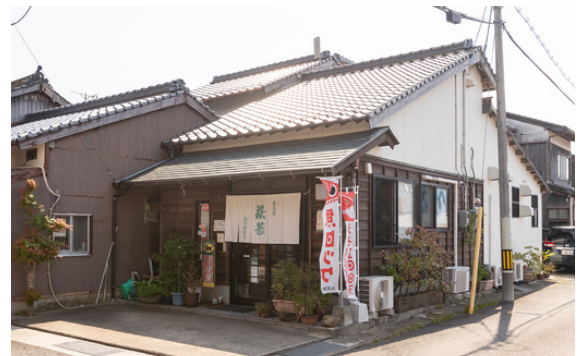
四代続く老舗蒲鉾店

秘伝のたれ漬けのエソの皮で包んだごぼう巻、油揚げに包んだ志田巻など、自慢の味も長年の人気商品である。明治時代の建物が多く残る史跡地区にある店舗は、地元の常連客や観光客が訪れ、贈答品やお土産として愛用されている。