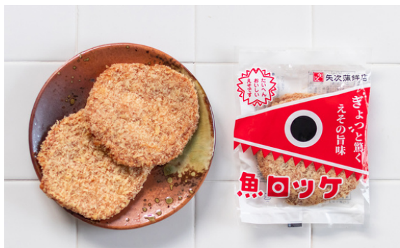
地元名物「魚ロッケ（魚のすり身の揚げ物）」

完成した「魚ロッケ」と「えそ100天」は、自店と地元のスーパー3ヶ所での販売が始まり、事業承継と商品開発の経緯が新聞やテレビでも取り上げられたことから予想を大幅に上回る売り上げとなった。一時は在庫切れになるほどの人気で、売り上げは前年比140%増を達成できた。現在は、ECサイトの立ち上げとSNSでの情報発信にもCOと一緒に取り組み、観光客へのPRや、全国的な販路開拓を目指している。